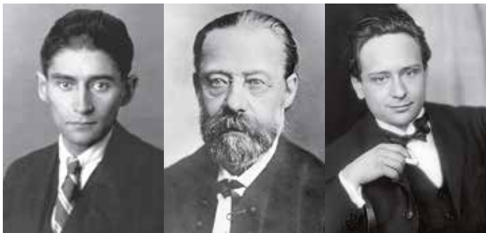
Fotos: Franz Kafka: Anonymous/Unknown author (see File:Kafka.jpg), Public domain, via Wikimedia Commons Bedřich Smetana: Unknown author (see File:FriedrichSmetana.jpg), Public domain, via Wikimedia Commons Viktor Ullmann: Jiri Meznický, CC0, via Wikimedia Commons

19:30 UHR | EINTRITT: 29,00 € | 14,50 € (ERMÄSSIGT)